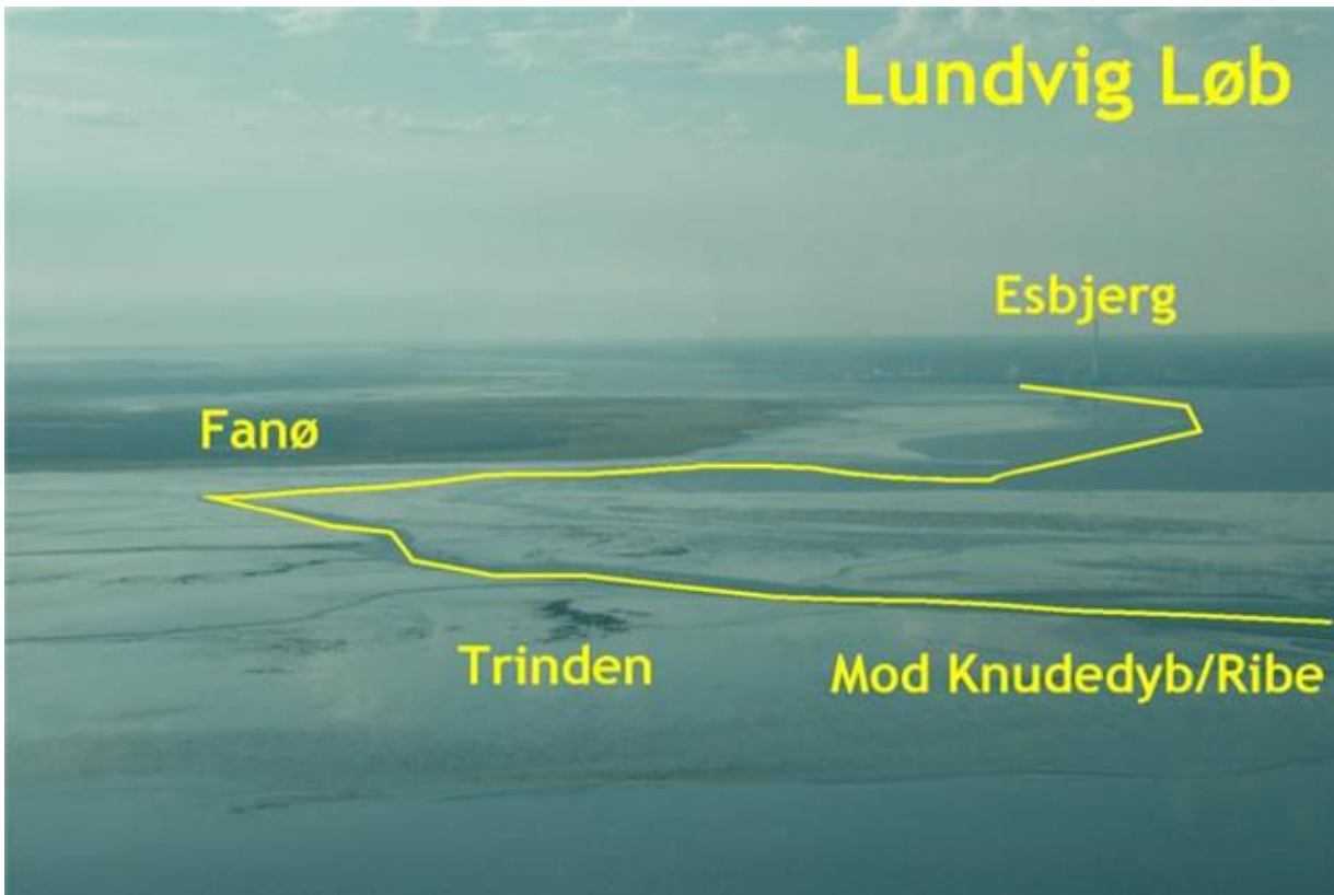
Flyets ca. position: 55*21'N / 8*35'E. Ca. retning 324*