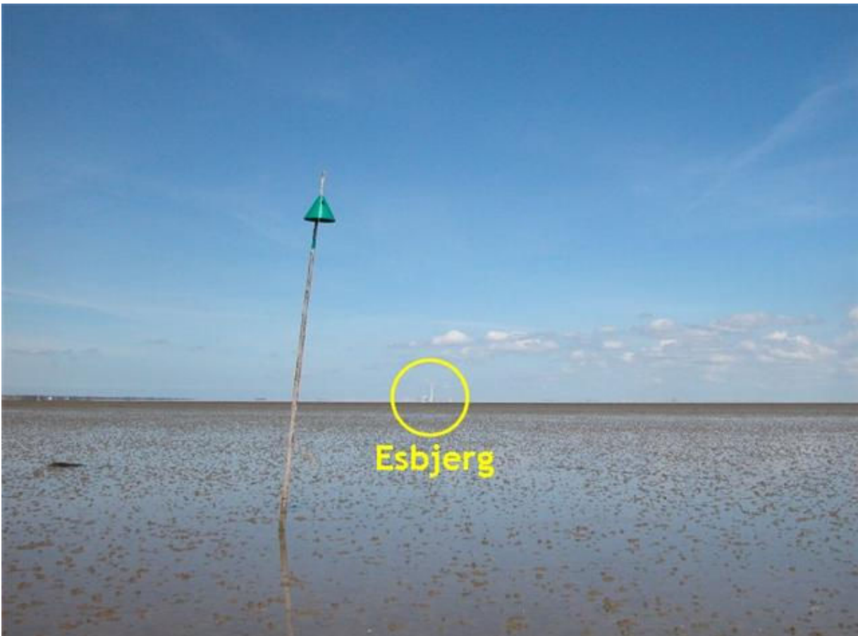
Sønder Keldsand "renden", 55° 19.651'N 8° 31.014'Ø