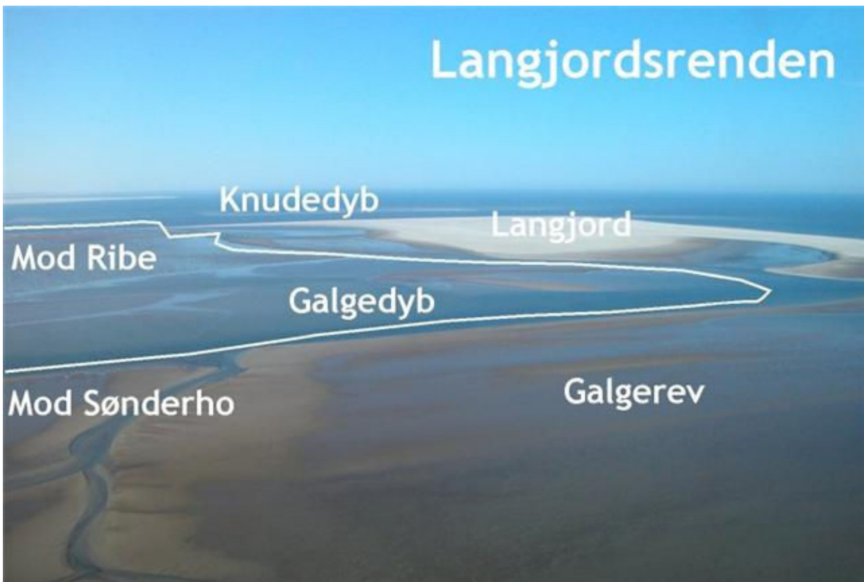
Flyets ca. position: 55*20,4N/8*28,7'E. Ca. retning 214*