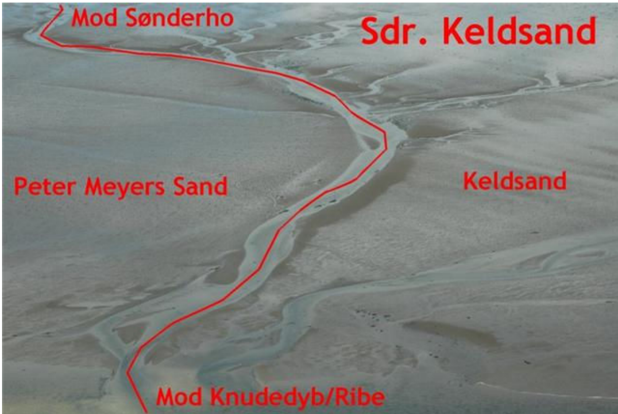
Flyets ca. position: 55*19,5'N/8*30,5'E. Ca. retning 300*