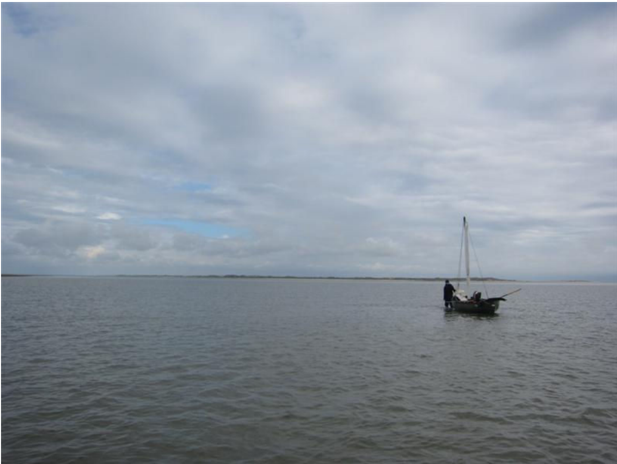
Vandskellet i Langjordsrenden. 55*19,3'N / 8*26,9'E