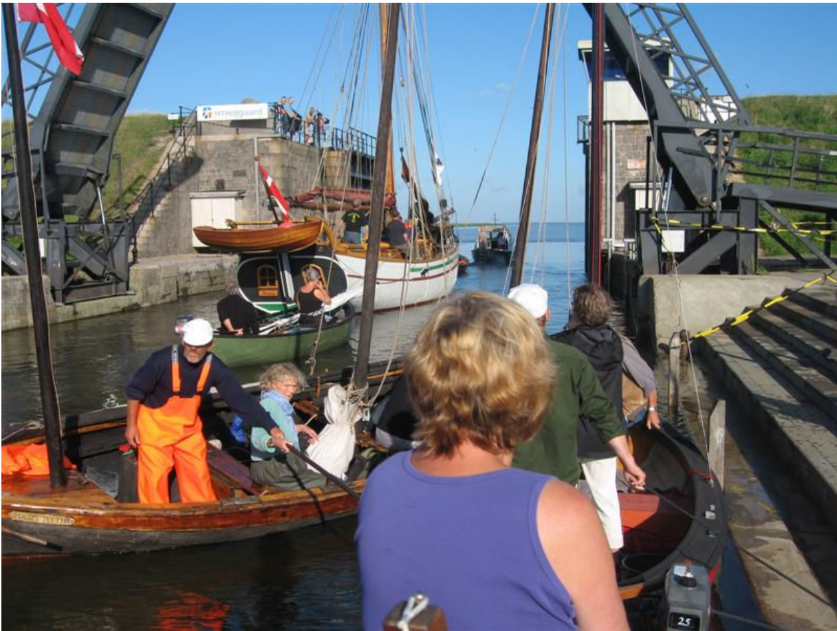
Udslusning gennem Kammerslusen