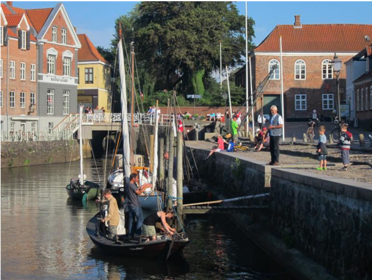
Skibbroen i Ribe