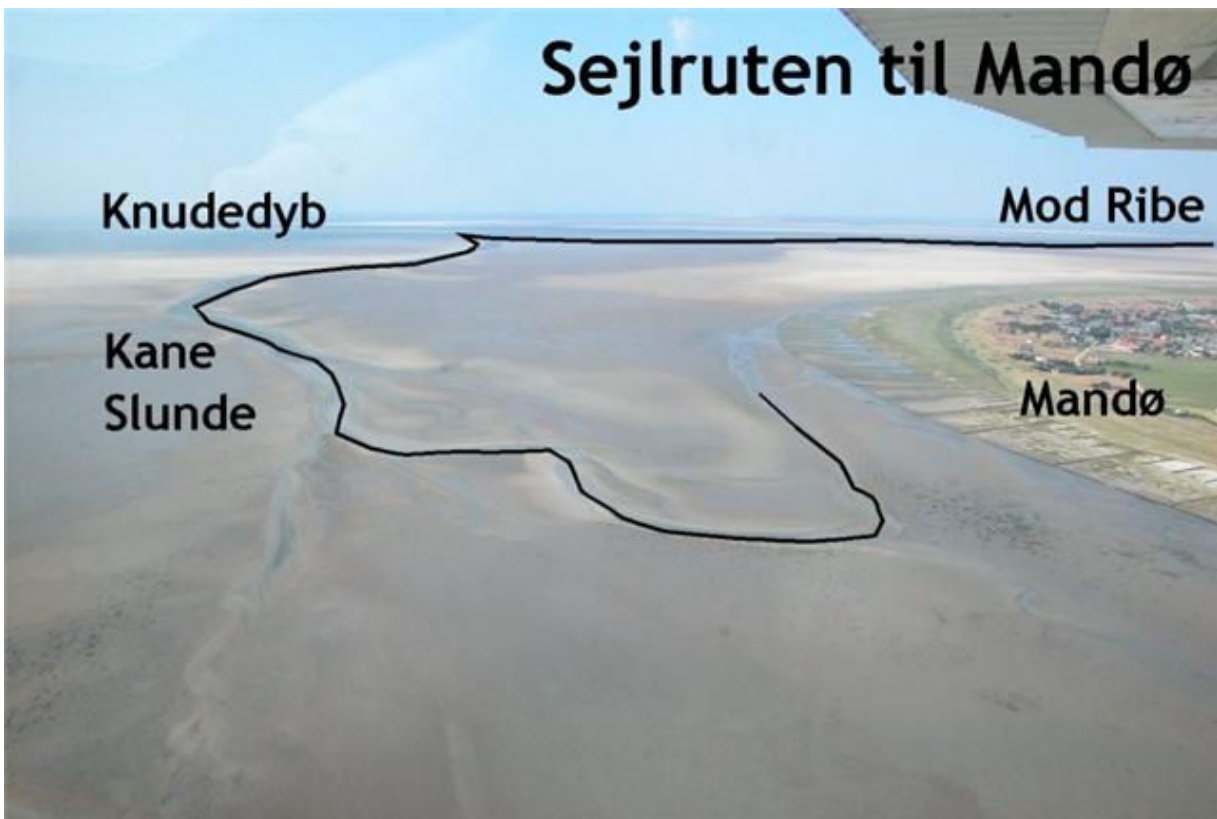
Flyets ca. position: 55*15,3'N / 8*32,8'E. Ca. retning 323*