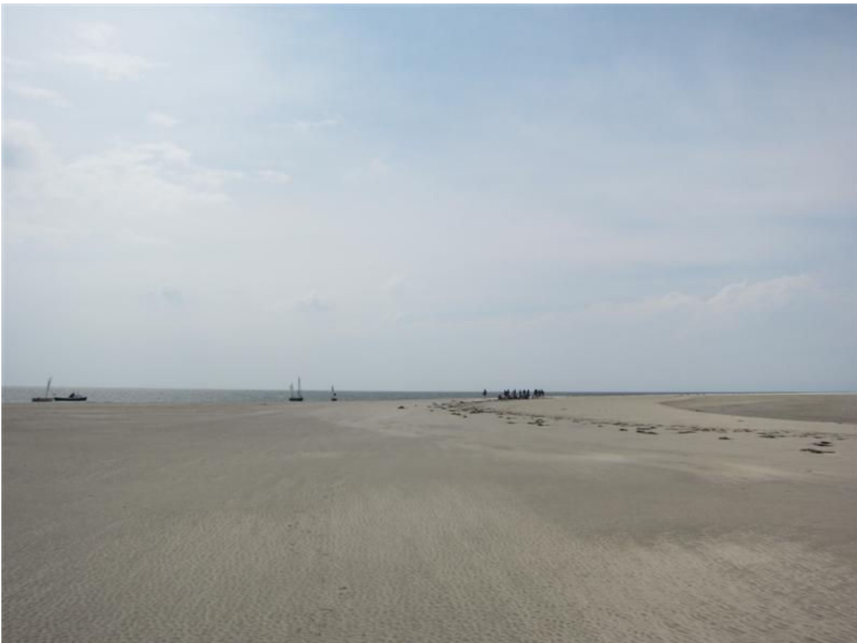
Frokost på Langjord