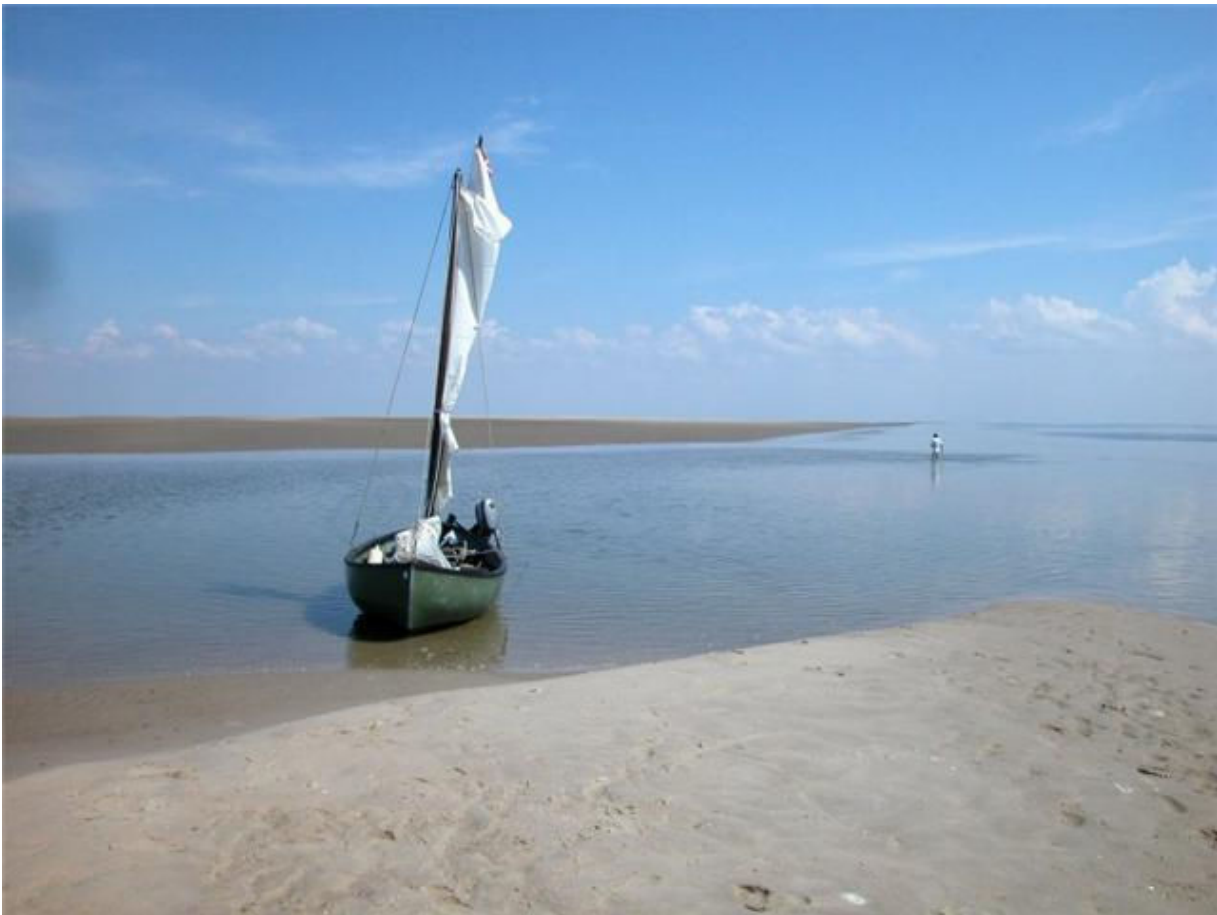
Langjordshullet. 55°18,668' N / 8°27,289' E