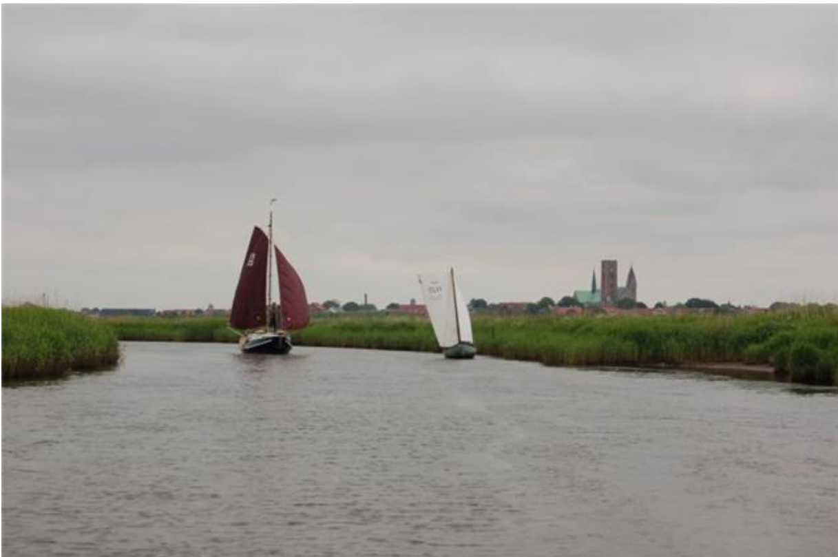
Ribe Vesterå, 55° 19.978'N 8° 44.465'Ø